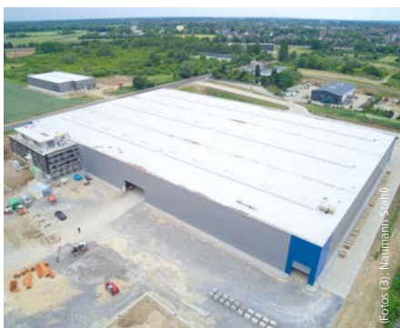
Naumann Stahl am neuen Standort in Neuss, neue Halle während der Bauphase